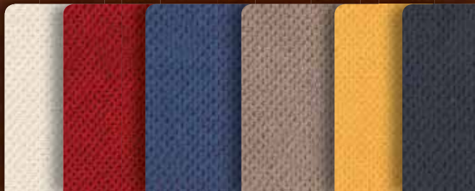
BEECH HIGH GLOSS – INTERIOR WOOD OPTION

Hai l'imbarazzo della scelta tra legno di ciliegio, mogano o Beech High Gloss oppure l'elegante pelle. Ci sono moltovarianti per personalizzare gli interni. Insieme al nostro concetto di cabina, ci sono possibilità mai viste prima.